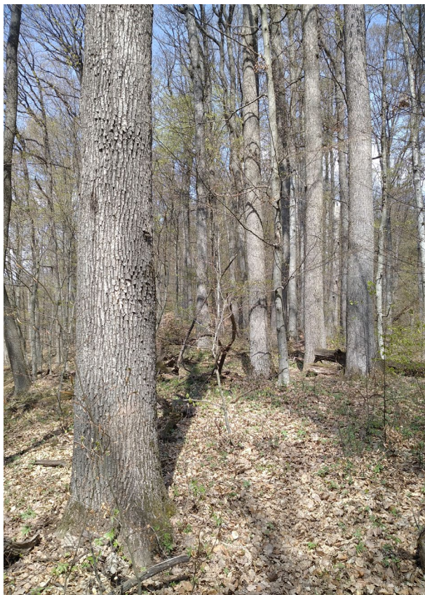
Рис. 2. Скельно-дубовий ліс в урочищі «Тепла яма» (, 22.05.2022)