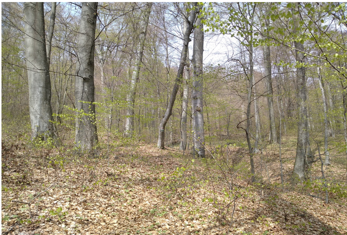
Рис. 3. Буково-дубовий ліс в урочищі «Тепла яма»