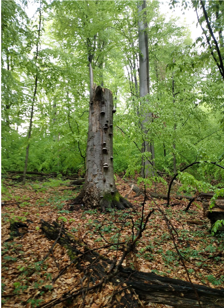
Рис. 4. Мертва деревина – оселище для мохоподібних в урочищі «Тепла яма»

Результати дослідження. Загалом на території ПП «Тепла яма» виявлено 60 видів бріофітів. Печіночники (Marchantiophyta) репрезентовані 1 класом, 3 порядками, 6 родинами, 7 родами і 8 видами (табл. 1). Лише Lophocoleaceae і Metzgeriaceae містять по 2 види, решта родин ( Plagiochilaceae , Frullaniaceae , Porellaceae , Radulaceae ) представлені по одному виду кожна. Мохи ( Bryophyta ) представлені 2 класами, 8 порядками, 24 родинами, 45 родами і 52 видами. Видовим багатством вирізняються родини Orthotrichaceae (9 видів), Brachytheciaceae (6), Neckeraceae і Amblystegiaceae (по 4), Polytrichaceae і Dicranaceae (по 3 види). Решта 18 родин включають 1-2 види кожна.