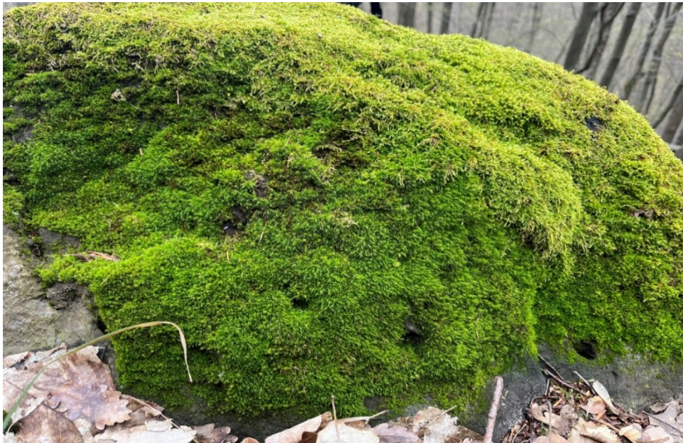
Рис. 5. Андезитові камені посеред скельнодубового лісу – оселище для епіксільних мохоподібних

Fissidens bryoides . На відслоненнях ґрунту в затінених місцях також зустрічаються Oxyrrhynchium hians , Brachytheciastrum velutinum , Brachythecium rutabulum .