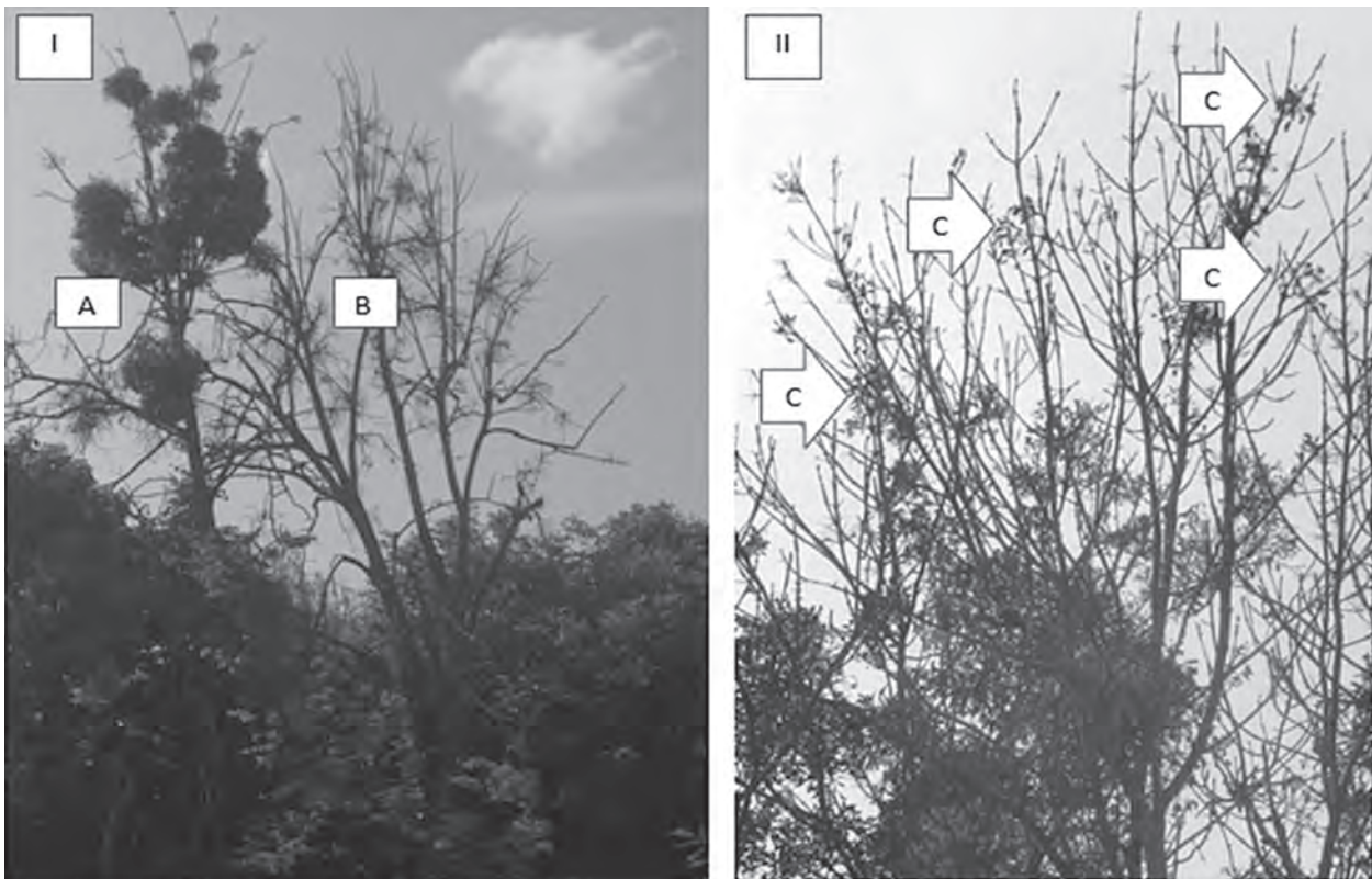
Рис. 2. Зліва на фото (I) два представники Populus nigra (м. Вінниця, о. Кемпа) Справа (II) верхня частина крони Fraxinus excelsior , м. Вінниця, вул. Академіка Янгеля.

Листки у омели супротивні, розташовані попарно, шкірясто-м'ясисті, видовженої овальної форми довжиною від 3 до 8 см. На розмір і форму листків також впливають умови розвитку напівпаразиту в межах окремих субпопуляцій.