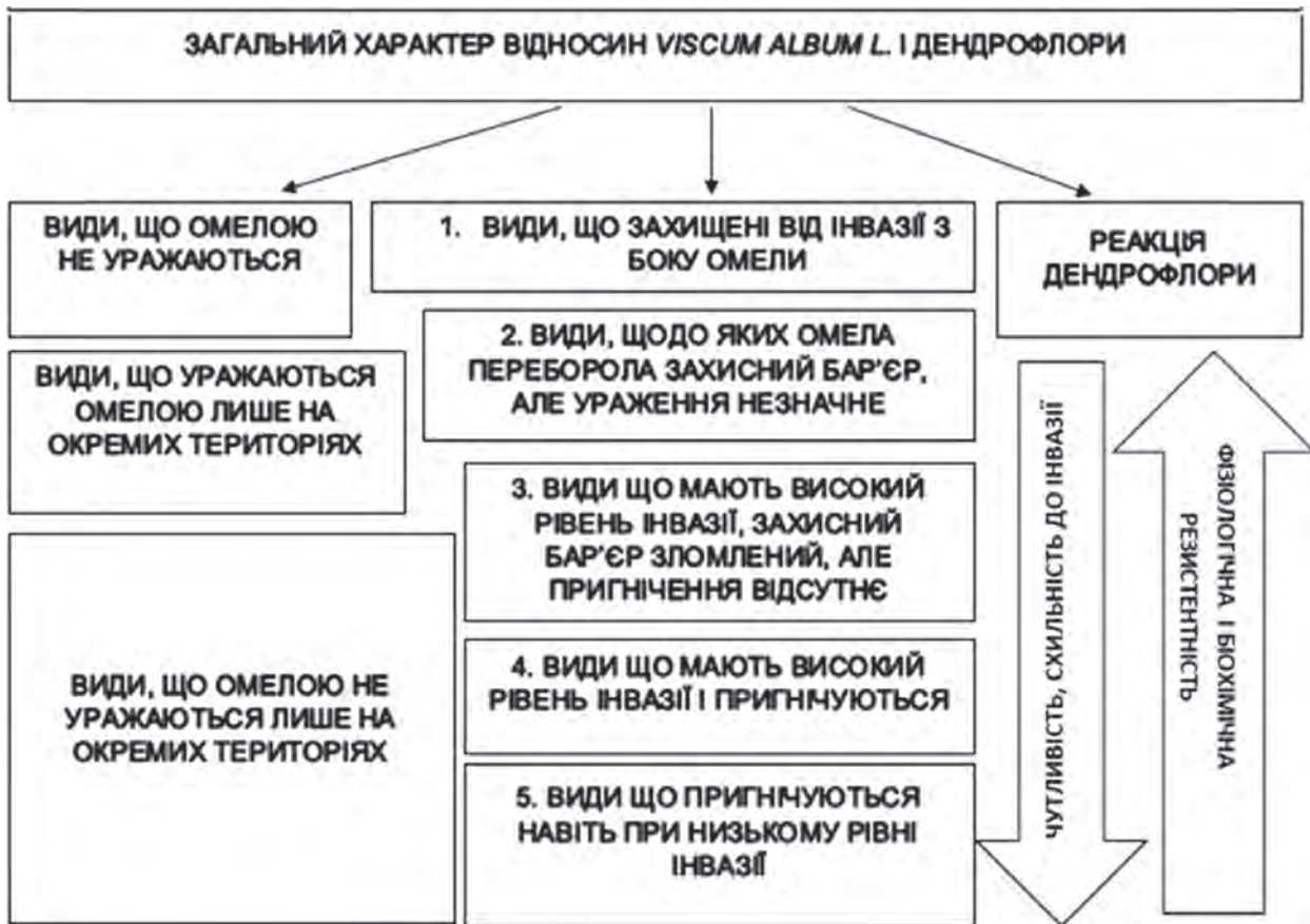
Рис. 4. Характер взаємовідносин Viscum album L з представниками дендрофлори. Зліва – географічна спеціалізація, по центру (1-5) – характер взаємовідносин омела-живитель, виділено 5 груп представників дендрофлори за чутливістю до омели, справа – загальна їх реакція на омелу.

За останні 20-30 років спостерігається суттєве збільшення агресивності і, відповідно, експансії омели. Деякі види дерев і кущів мають високу чутливість, або, навпаки, істотний захисний потенціал, який проявляється завдяки їх біорезистентності до геміпаразита. Фізіологічні та біохімічні механізми супротиву окремих видів поширенню омели, захоплення паразитом як нових видів, так і територій шляхом її адаптації, потребують подальшого вивчення. Сьогодні омела перебуває у швидких адаптаційних процесах і має суттєвий вплив на природні та штучні екосистеми.