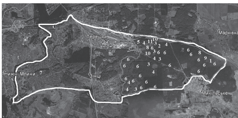
Рис. 2. Дані щодо поширення окремих видів рідкісних судинних рослин (номер виду відповідає тому, який зазначений у табл. 1; окремою лінією виділено ту територію околиць села Терешки, якій ми пропонуємо надати заповідний статус)

Висновок. На основі аналізу літературних даних з'ясовано, що детального вивчення охоронюваних видів судинних рослин околиць села Терешки раніше не проводилося. У науковій літературі присутні лише окремі відомості про поширення деяких рідкісних видів