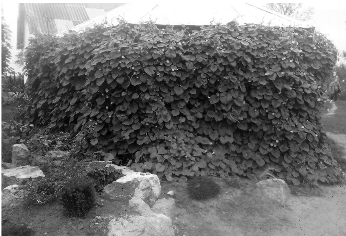
Рис. 5. Декор альтанки Ipomoea purpurea у Ботанічному саду БНАУ