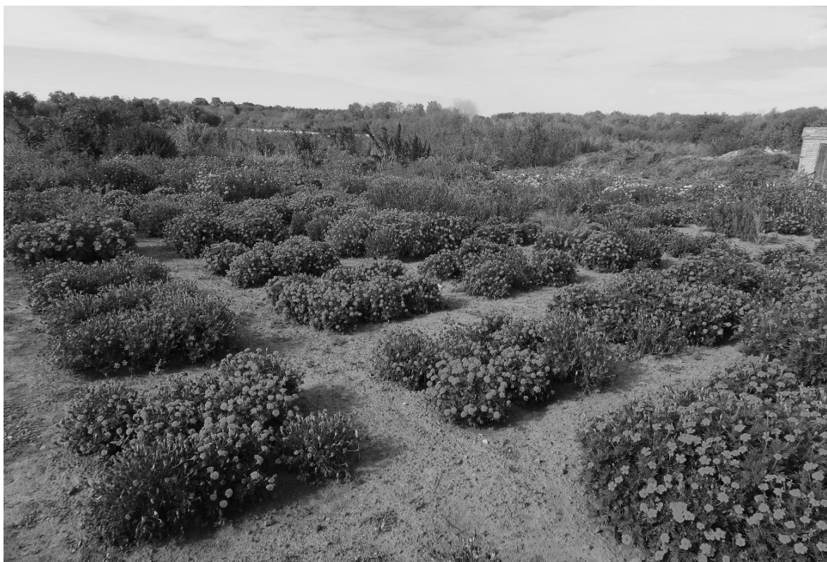
Рис. 4. Тагетарій у Ботанічному саду Білоцерківського НАУ