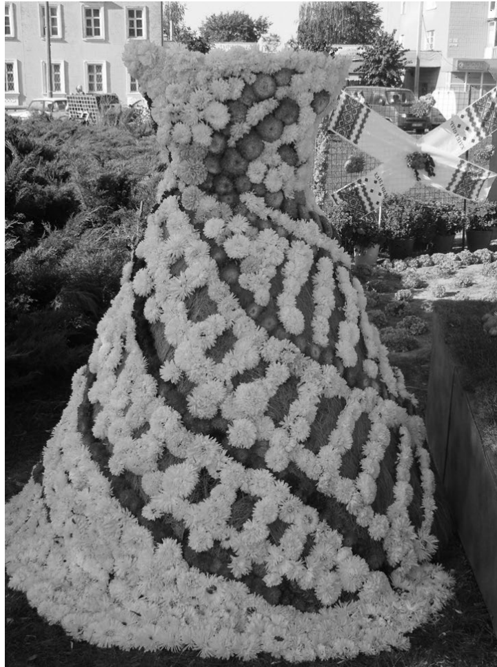
Рис. 6. Макет сукні з живих квітів Callistephus chinensis на квітковій виставці у м. Біла Церква

Висновки. Колекція однорічників Ботанічного саду БНАУ нараховує 76 видів і 267 сортів, що належать до 61 роду і 27 родин. Основу сортового багатства колекції складають 171 сорт Callistephus chinensis (L.) Ness. та 42 сорти роду Tagetes L. За способом застосування 53% видів колекції належать до гарноквітучих, 21% – до листяно-декоративних, 10% – до духмяних, 7% – до сухоцвітів, 5% – до витких і 4% – до килимових однорічників. Завдяки витривалості і стійкості до ґрунтово-кліматичних умов лісостепу 78,3% видів і сортів колекції придатні для посіву безпосередньо в ґрунт на постійне місцезростання і лише 21,7% потребують розсадного способу вирощування. Більшість видів і сортів колекції – 54,2% характеризуються як середньорослі (40-80 см), 34,5% – низькорослі (10-40 см) рослини і лише 11,3% мають висоту понад 80-150 см і більше. Однорічники – це група видів і сортів квітниково-декоративних рослин, які завдяки морфологічному різноманіттю, рясному і тривалому квітуванню, стійкості до абіотичних та біотичних чинників забезпечують декоративність квітників різного функціонального призначення в урбоекосистемах впродовж літньо-осіннього періоду. За витратами на створення та експлуатацію квітникові насадження з однорічників високовартісніші порівняно з трав'яними багаторічниками, але вони дозволяють змінювати дизайн ландшафту щороку і відзначаються високою декоративністю впродовж тривалого періоду квітування.