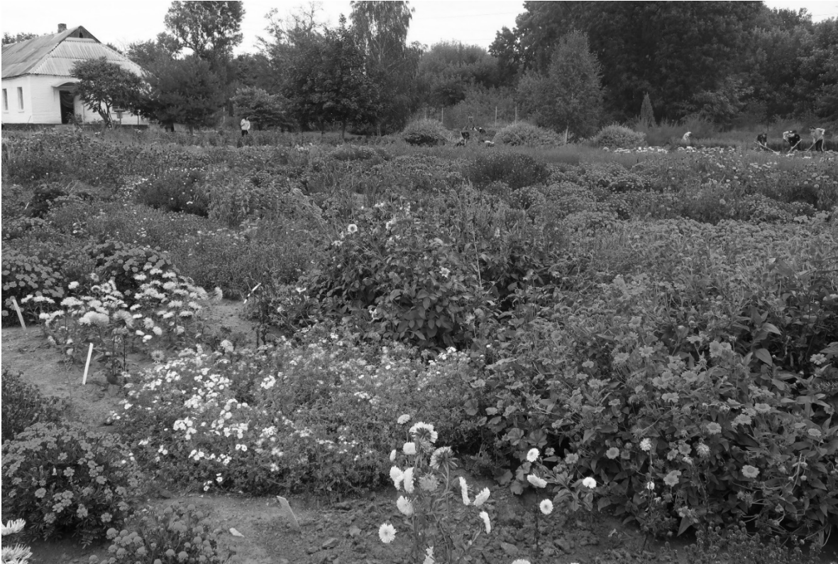
Рис. 1. Колекційна ділянка однорічників у Ботанічному саду БНАУ

килимові, декоративно-листяні і горщечкові культури. Проте всі ці класифікації умовні, оскільки, до прикладу, Heliotropium arborescens L., Tagetes erecta L. відносять і до групи гарноквітучих і до групи духмяних видів. У розподіл видів колекції однорічників Ботанічного саду БНАУ за способом застосування ми виділили групи гарноквітучих, листяно-декоративних, сухоцвітів, витких, килимових і духмяних однорічників. Найбільша кількість 40 видів колекції належать до гарноквітучих, 16 – до листяно-декоративних, 8 – до духмяних, 5 – до сухоцвітів, 4 – до витких і 3 – до килимових однорічників (рис. 2).